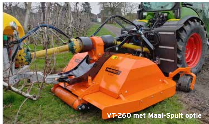
VT-260 met Maai-Spuit optie