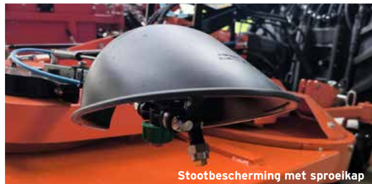
Stootbescherming met sproeikap