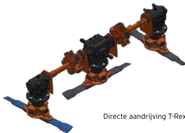
Directe aandrijving T-Rex