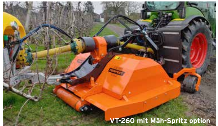
VT-260 mit Mäh-Spritz option