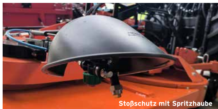
Stoßschutz mit Spritzhaube